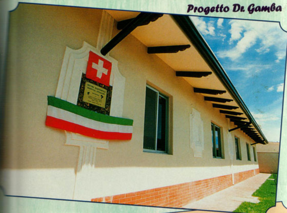
Una veduta della costruzione dell'ultima parte dell'Ospedale.