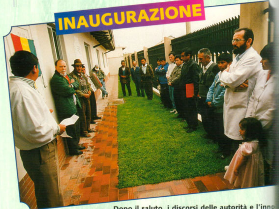
Dopo il saluto, i discorsi delle autorità e l'inno nazionale viene scoperta la targa-ricordo.