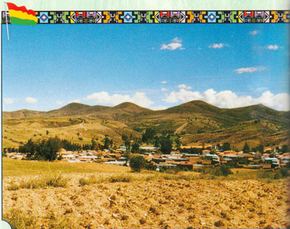
Una veduta di Anzaldo e dell'Ospedale Dr. Gamba...